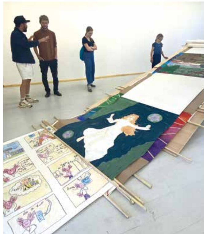
Das Paradebuch als Teil der Jahresausstellung der Akademie der Bildenden Künste München in der Textilwerkstatt

Hinter diesem vierteiligen Schaustück verbergen sich aber auch weitere zentrale Fragestellungen an der Schnittstelle von Kunst und Pädagogik. Denn, wenn dem Denken Hannah Arendts zufolge Kinder immer Schutzbefohlene und Neuankömmlinge zugleich sind, dann sind sie zu schützen vor den Krisen und Problemen der Erwachsenenwelt und insbesondere vor dem Versuch der Erwachsenen, ihre Probleme über die Erziehung der Kinder lösen zu wollen. „Unsere Hoffnung hängt immer an dem Neuen, das jede Generation bringt; aber gerade weil wir hierauf unsere Hoffnung setzen können, verderben wir alles, wenn wir versuchen, das Neue so in die Hand zu bekommen, dass wir, die Alten, bestimmen können, wie es aussehen wird.“ (Hannah Arendt) Statt diesen Widerspruch von Kunst und Pädagogik, Akademie und Schule, der die Arbeit jeder Kunstlehrkraft prägt, auflösen zu wollen, schlagen wir vor, gemeinsam zu viel an Kunst zu produzieren und darauf fröhlich mit einem Zuviel an Pädagogik zu antworten. Diese Gedanken bereiten den Grund, auf dem sich das Buchobjekt in der Akademie ausbreitete. Wir danken allen, die sich beteiligt haben!