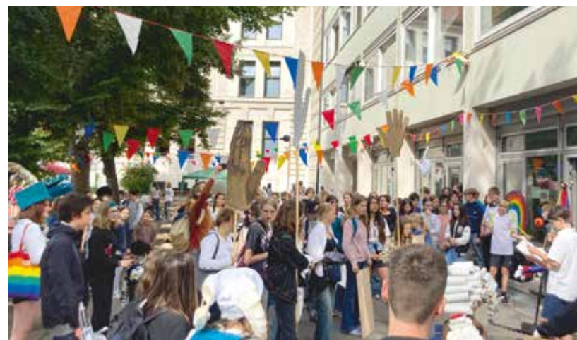
Auftakt der Buchparade am 23. Juli 2024 auf dem Schulhof des Theresien-Gymnasiums