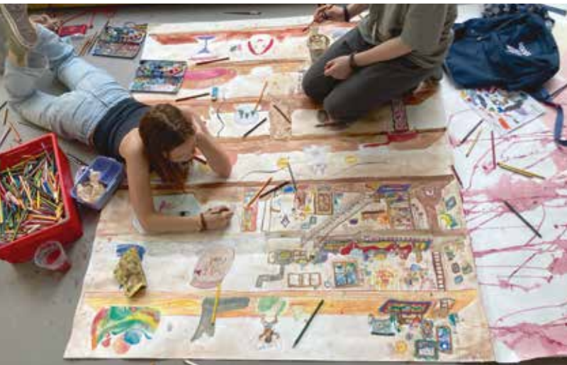
Arbeit am Paradebuch in der Kunstinsel