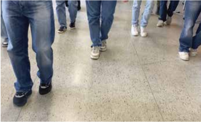
Die experimentelle Arbeit an der Choreografie der Parade