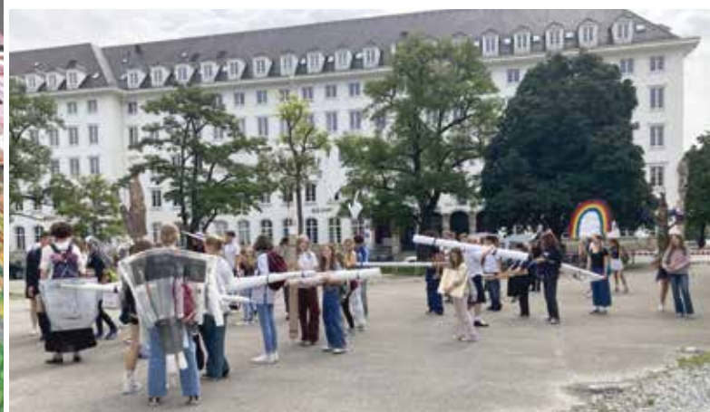
Zwischenstop an der Pinakothek der Moderne, Fotos: Karl/Schemmel

Weiter ging es über die schmalen Bürgersteige Schwabings zur Akademie der Bildenden Künste. Nach einem gemeinsamen Mittagessen in der Mensa wurden dort das Paradebuch und die Requisiten in einem großen, für uns freigehaltenen Werkstattraum