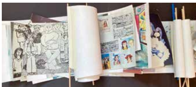
Modell des Paradebuchs mit seiner experimentellen Rollenkonstruktion