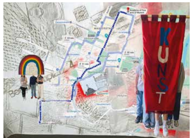
Die Strecke der Buchparade und ausgewählte Requisiten der 7a, kombiniert mit einer Frottage und Tuschezeichnung der 11ab, Collage: Karl