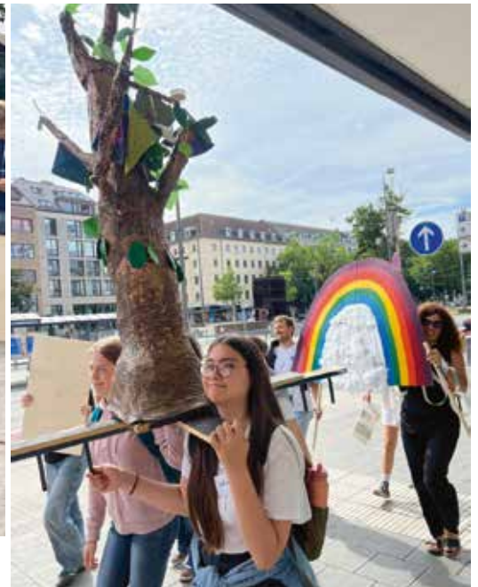
Die Buchparade unterwegs auf der Münchner Sonnenstraße.