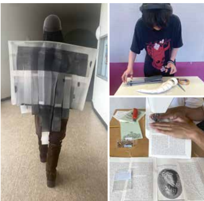
Kostümentwicklung der 11ab vom Theresien-Gymnasium